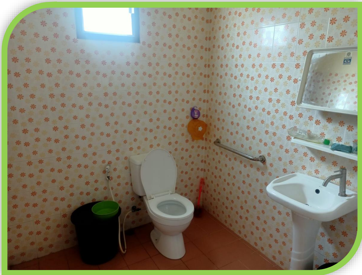
กิจกรรมจัดตั้งศูนย์คนพิการ